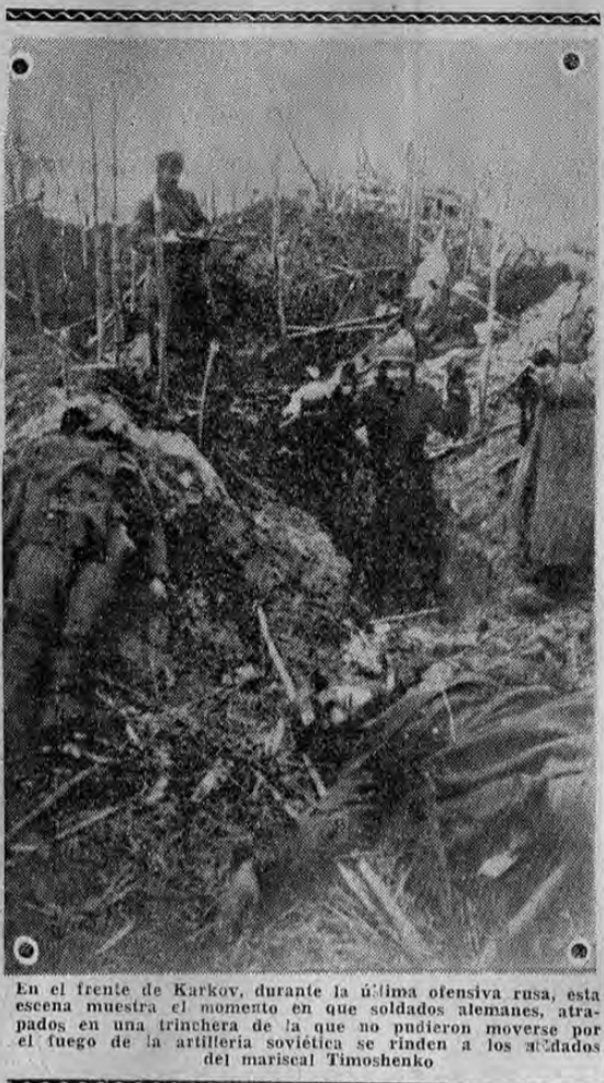
En el frente de Karkov, durante la última ofensiva rusa, esta escena muestra el momento en que soldados alemanes, atrapados en una trinchera de la que no pudieron moverse por el fuego de la artillería soviética se rinden a los soldados del mariscal Timoshenko